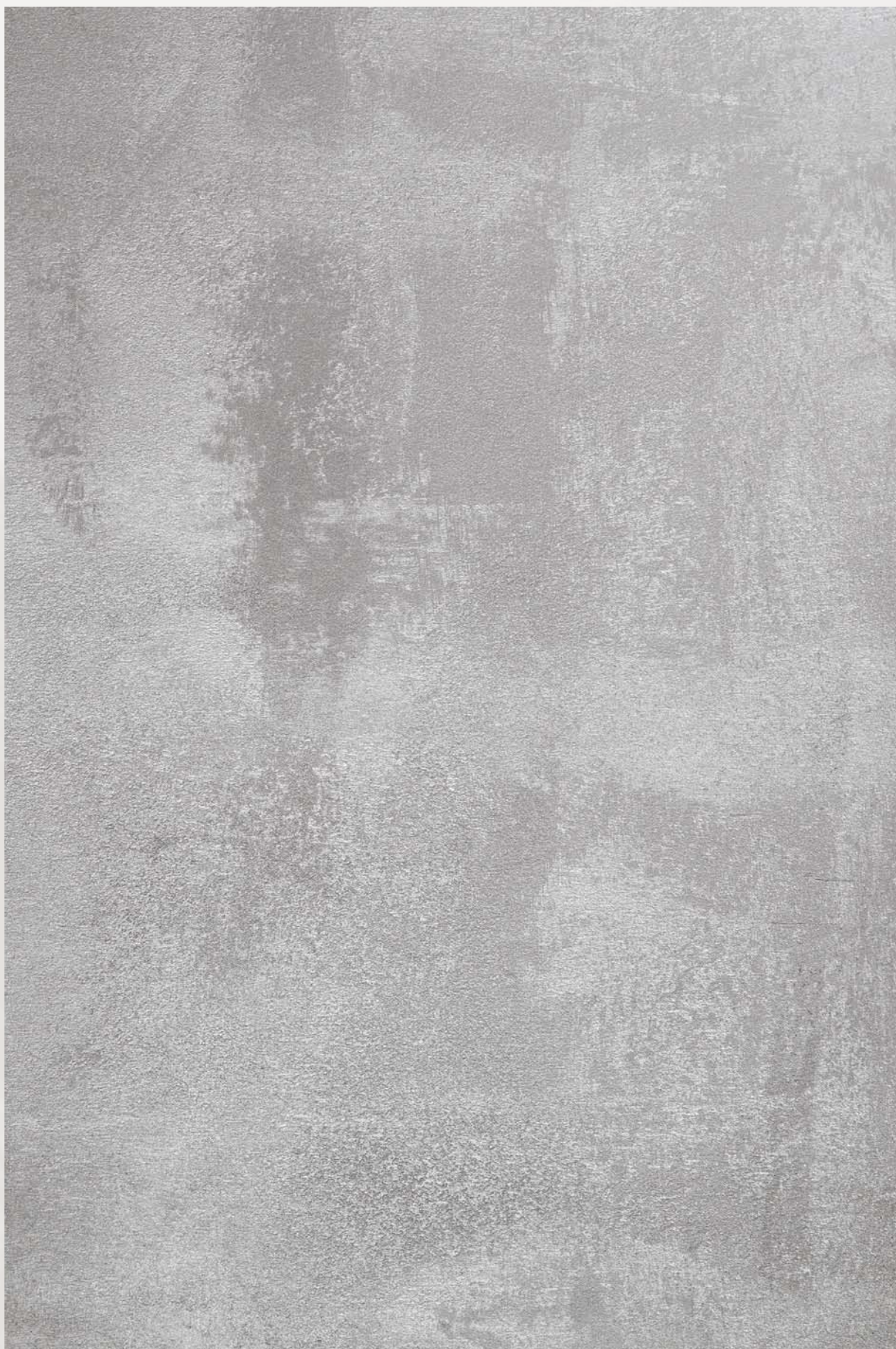
Animamundi AMS 429 effetto Metal Core

Le tonalità qui riprodotte, pur avvicinandosi a quelle di fornitura, sono indicative. Per una corretta lettura dei colori si raccomanda di consultare questa cartella alla luce solare. The colour shades herein reproduced are purely indicative, as small variations may occur. For a correct reading of the colors it is recommended to examine the catalogue under direct sunlight.