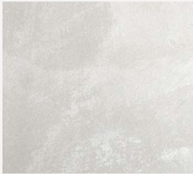
Animamundi Base Silver

Conducimi dal non essere all'essere dalle tenebre alla luce dalla morte all'immortalità