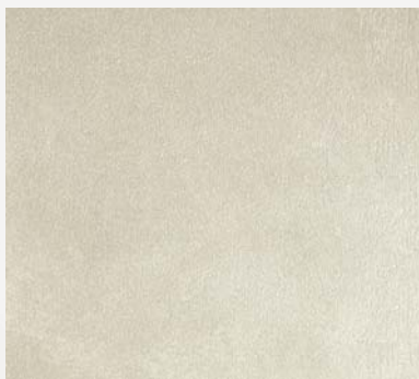
Animamundi Base Gold